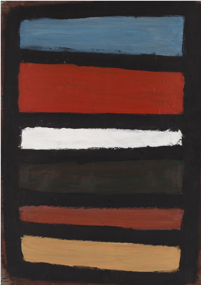
»o.T.«, 1985, Mischtechnik auf Papier, 630 × 481 mm

AGITATION DER POESIE | 6. April – 26. Mai 2024